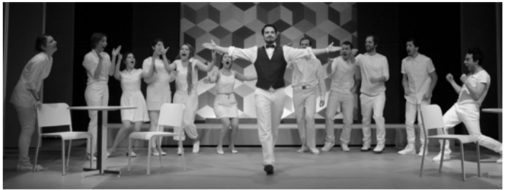
Les parallèles se rejoignent à l'infini , création des finissants en Jeu et en Scénographie

Quel bonheur j'ai eu de me joindre à l'équipe du Conservatoire d'art dramatique de Québec cette année ! Je tiens tout d'abord à féliciter chaleureusement les seize finissants qui ont obtenu leurs diplômes en mai 2016 : douze en Jeu et quatre en Scénographie . Je sais à quel point la troisième année est importante pour leurs carrières naissantes et remplie de défis exaltants. Ils et elles les ont relevés avec brio. Découvrez nos finissants.