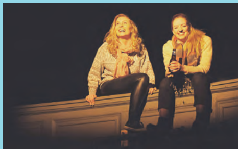
Brûlures, une création des finissants 2018, décembre 2017