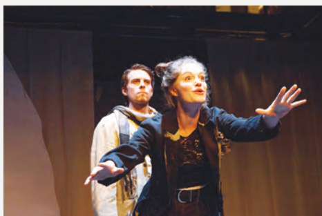
Jours possibles, récital poétique, novembre 2017

Le Conservatoire d'art dramatique de Québec tient à remercier son partenaire pour cette saison.