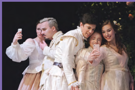
Beaucoup de bruit pour rien , de Shakespeare, mai 2018