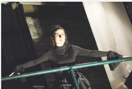
Jours possibles , récital poétique, novembre 2017