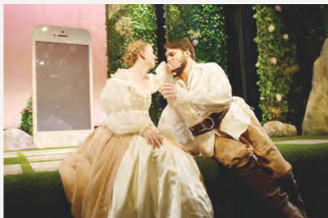
Beaucoup de bruit pour rien, de Shakespeare, mai 2018

Et merci à vous, généreux donateurs de la grande région de Québec. Par votre engagement, vous permettez aux jeunes artistes de parfaire leurs connaissances, de se concentrer sur leur art, de lancer leur carrière et d'inspirer les générations futures.