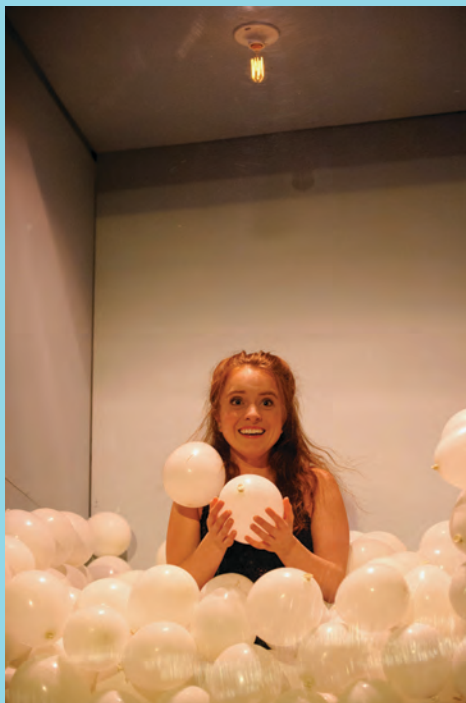
Brûlures , une création des finissants 2018, décembre 2017