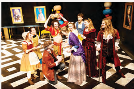
Le Bourgeois gentilhomme, de Molière, février et mars 2018